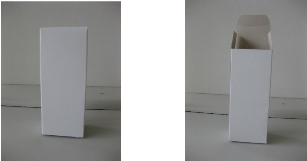
Figura 2. Embalagem secundária constituída de cartucho de papel cartão Ecopack®, utilizada para acondicionamento da embalagem primária contendo amostra em estudo.

Após acondicionamento da amostra em sua embalagem primária, o conjunto foi transferido para cartucho de papel cartão Ecopack® 320g/cm 2 com dimensões de 47mm x 35mm x 117mm (comprimento x largura x altura). A Figura 2 ilustra o modelo do cartucho desenvolvido.