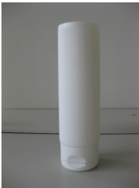
Figura 1. Embalagem primária do tipo bisnaga de Polietileno de Baixa Densidade (PEBD) com dimensões de 35mm de diâmetro 117mm de altura escolhida para acondicionamento do creme de ureia a 5%.

A amostra foi acondicionada em embalagem primária do tipo bisnaga de Polietileno de Baixa Densidade (PEBD), opaca, com dimensões de 35mm de diâmetro 117mm de altura e batoque com orifício de 5mm de abertura. A Figura 1 ilustra o modelo da bisnaga desenvolvida.